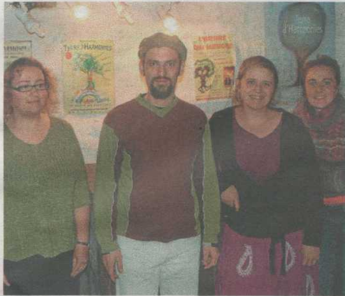
L'équipe de l'Arbre qui marche a choisi les Monts d'Arrée pour la 4 e édition de son festival écolo musical

Événement principal porté par la structure: un « Eco festival » pour le moins original puisqu'il se veut sans alcool pour « marquer le coup par rapport à l'histoire de certains peuples où l'arrivée de l'alcool a été destructrice ». Au prochain festival de l'« Arbre qui marche » on se veut ouvert aux cultures des musiques traditionnelles fondées sur des instruments simples et ethniques: didgéri-doo, guimbarde, arc en bou-