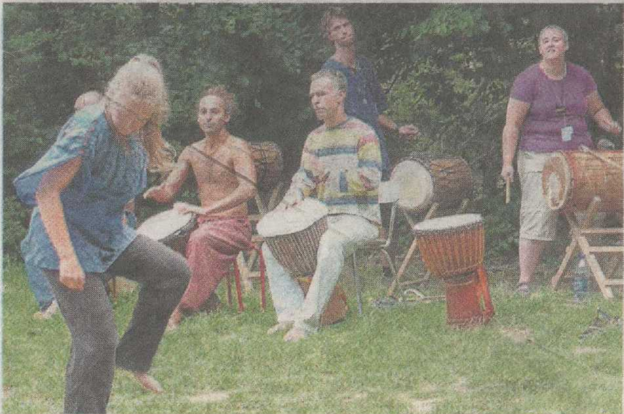
Terre d'harmonie a pris ses quartiers à Saint-André-des-Eaux pour trois jours. Un festival basé sur l'environnement et les musiques traditionnelles.

de musique traditionnelle sont gâtés par les différents groupes venus de très loin pour certains, notamment de Cuba ou d'Afrique. Le festival est sans alcool, on peut venir savourer les repas végétariens ainsi que les boissons bio. De nombreuses animations sont aussi destinées aux enfants, des ateliers gratuits sur la danse, la musique, l'artisanat ou la relaxation sont proposés aux familles. Le festival est aussi un moment de conférences et d'échange sur l'environnement.