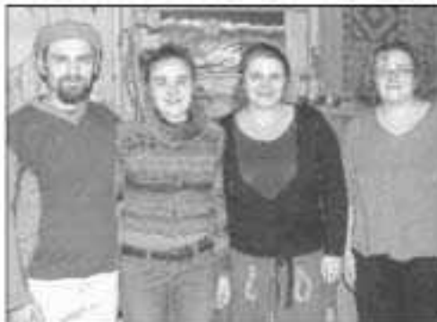
L'association cherche toujours un terrain, d'environ huit hectares, pour organiser son éco-festival.

Elle veut réunir un large éventail de traditions et savoir-faire autour de la problématique de prendre soin de la planète, de soi et de l'autre. Son originalité