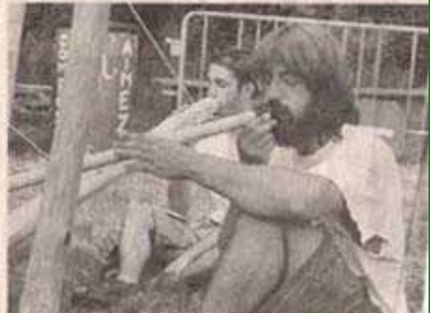
Le festival, un des instruments les plus joués sur le festival, a toujours réuni à travers les années.