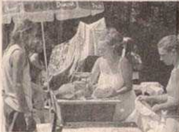
Le festival de part de au sein d'une des activités proposées sur le festival.