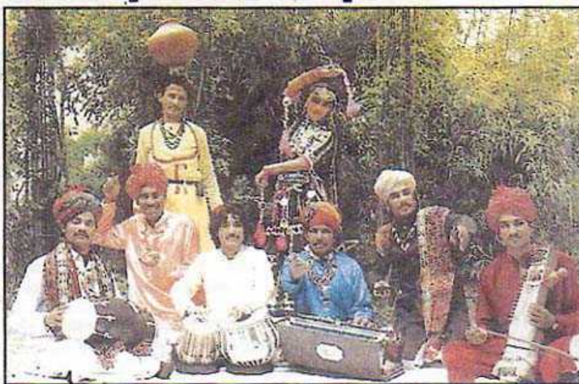
Les Gitans Dhoad venus du Rajasthan proposent une musique subtile, éthique et spirituelle.

Les Gitans Dhoad prendront le relais : six musiciens, une