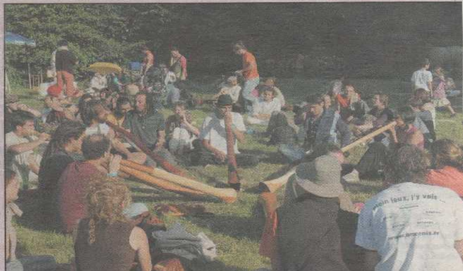
Un grand rassemblement autour des musiques ethniques dont le didgeridoo, très à l'honneur (archives)

C'est donc non seulement une rencontre musicale mais aussi un lieu pédagogique