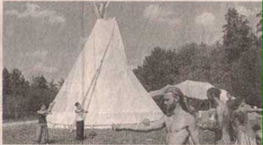
La 1500 e place près de l'été, une culture qui se voit de nos jours.

Le public est venu en famille du Grand Ouest et a pu également apprécier plusieurs habitants de Saint-André-des-Eaux pour qui le festival était plaisir aux organisateurs. Une troisième édition pourrait voir le jour en 2010, la décision sera prise en fin d'année.